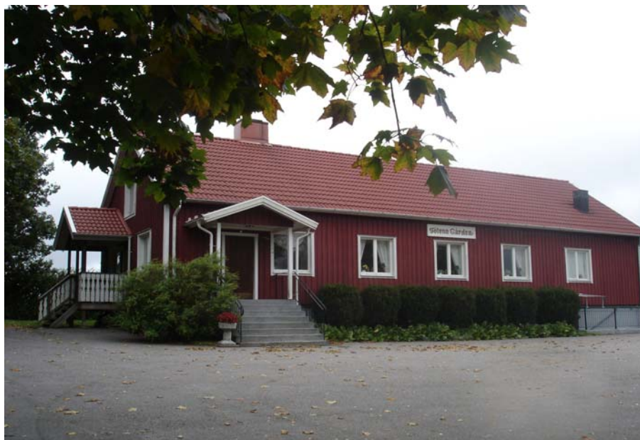
Fölene Bygdegård, med plats för upp till 120 personer.