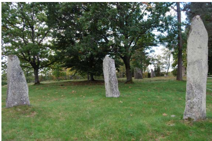
Nycklabacken, Västergötlands största gravfält