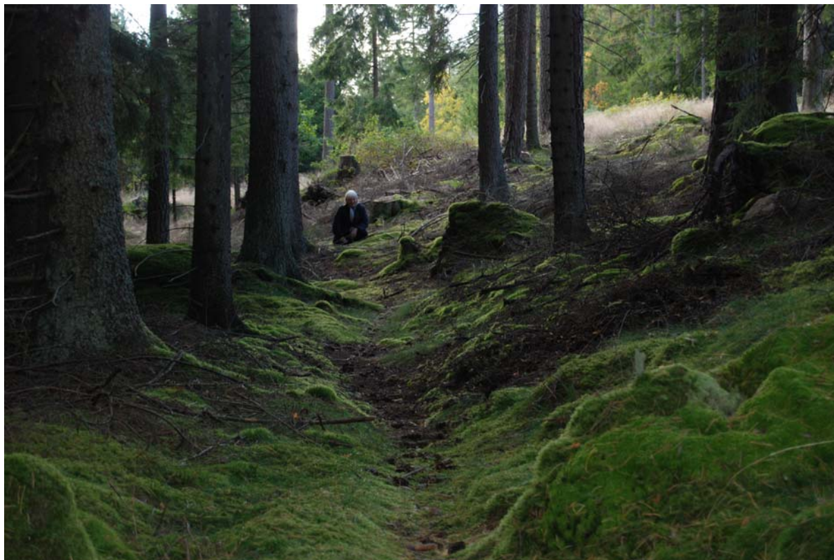
Hålvägen (medeltida ridväg) i Hackebergsskogen