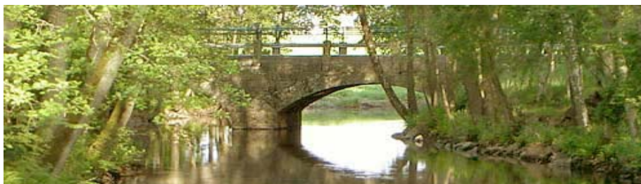
Den vackra tvåvalsbron i Fölene