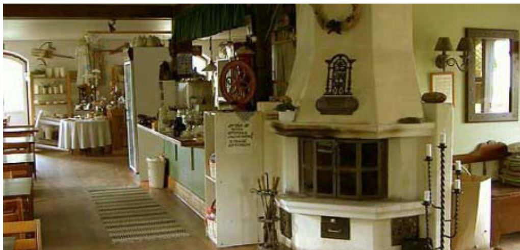
Fölene Kvarn: Gott kaffe och kaffebröd - även hembakat. Smarriga smörgåsar. Glass och godis.