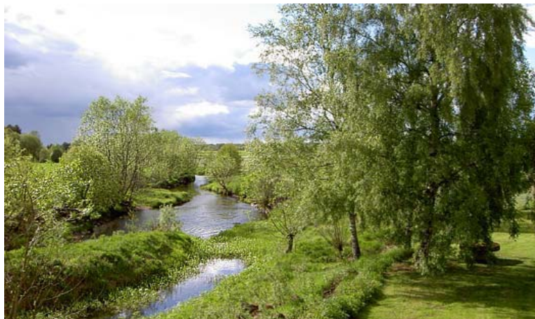
Nossan som flyter genom Fölene är norra Europas mest artrika fiskevatten!

Samtliga dessa platser bör skyddas från exploatering av t ex bostäder och industri!